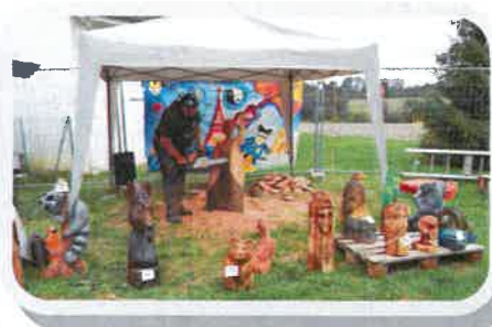
FAM - démonstration sculpture sur bois