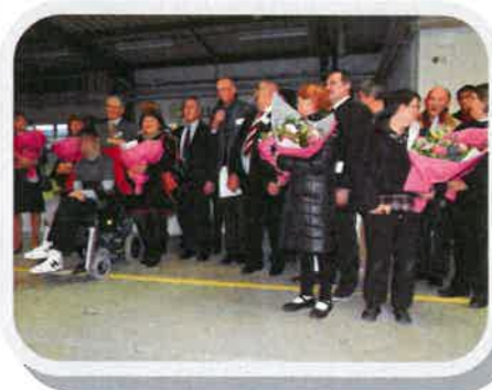
Vœux 2016 à Clamecy