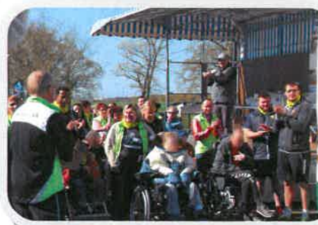
Ronde de Feuilles 2016