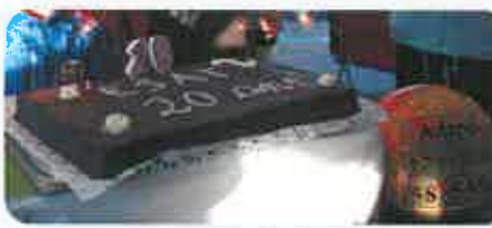
12 octobre : 20 ans de l'ESAT & Inauguration de la SAS