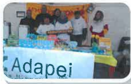
Téléthon les 2 et 3 décembre