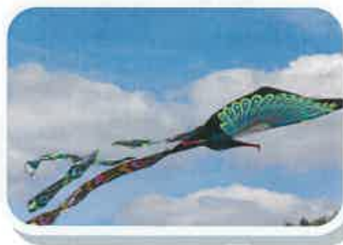
Journée Cerfs-Volants le 06 juillet