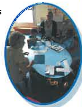
L'équipe de l'UEMA