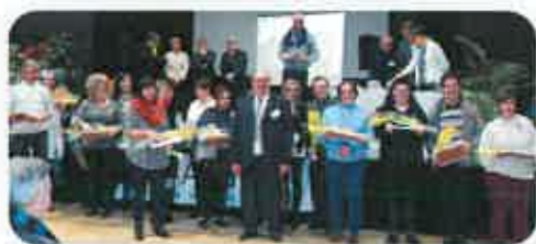
Vœux 2017 à Coulanges Les Nevers