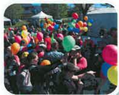
Ronde de Feuilles 2017