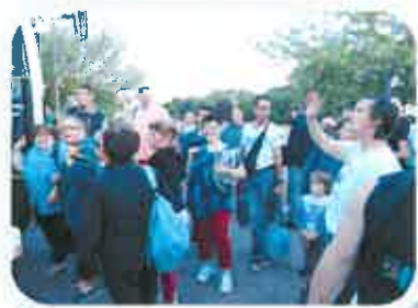
ESAT—Sortie Europa Park—Juin 2017